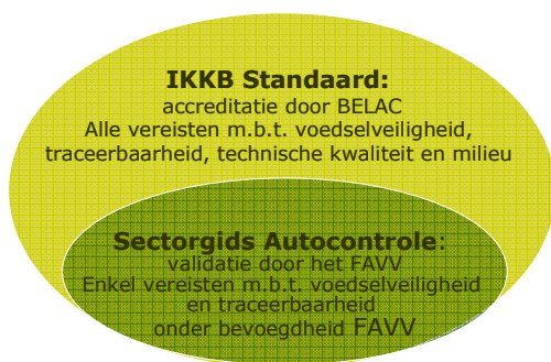
Fig. 3 Relatie tussen de IKKB Standaard en de Sectorgids Autocontrole voor de Primaire Plantaardige Productie.

Het verschil tussen de IKKB Standaard en de Sectorgids Autocontrole voor de Primaire Plantaardige Productie wordt weergegeven in Fig. 3.